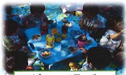
ピクニックランチ