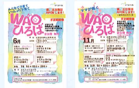
WAOひろば告知チラシ前半→後半