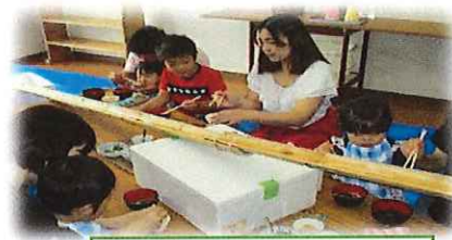
流しそうめん大会